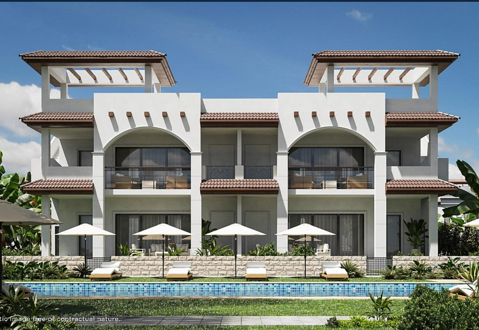
Image free of contractual nature