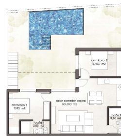
PB / GROUND FL.