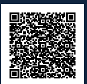
ISO A3 - ESCALA 1:75