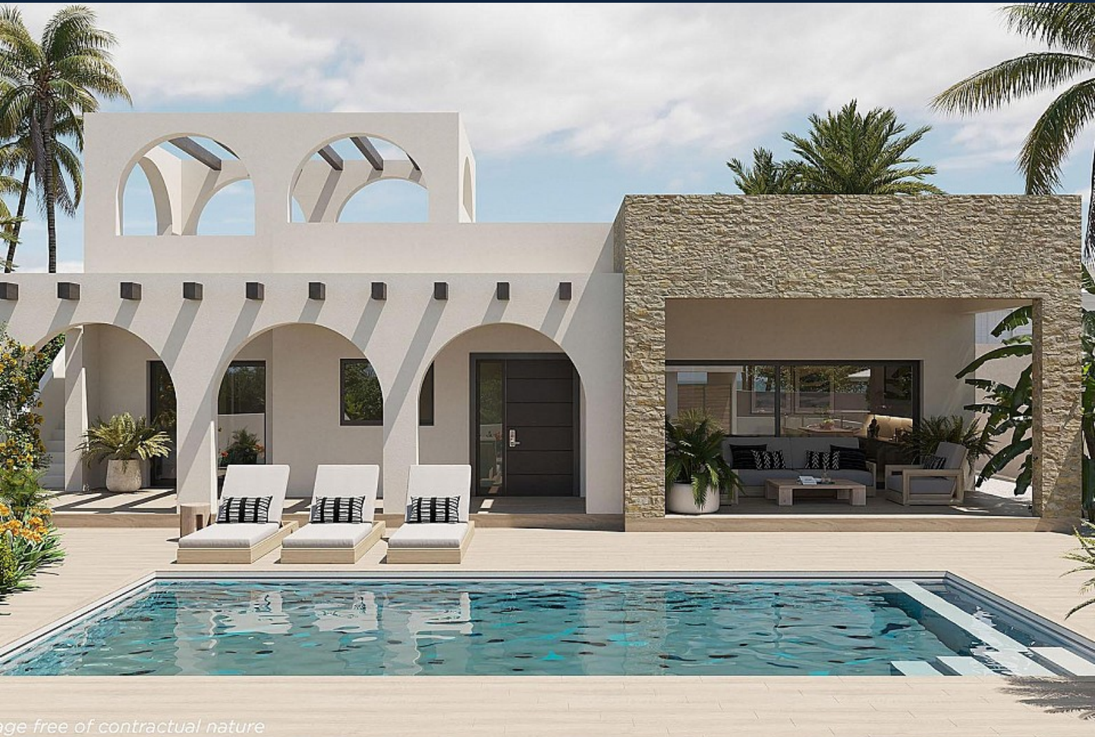
Image free of contractual nature