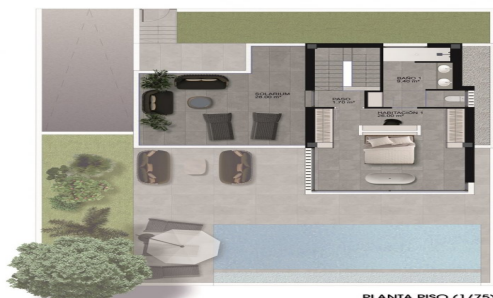
PLANTA PISO (1/75)

PARCELA 05 271.00 m 2 SUPERFICIE CONSTRUIDA SÓTANO 180.50 m 2 SUPERFICIE CONSTRUIDA PLANTA BAJA 80.90 m 2 SUPERFICIE CONSTRUIDA PLANTA PISO 45.50 m 2 SUPERFICIE CONSTRUIDA TOTAL 306.90 m 2 SUPERFICIE CONSTRUIDA TOTAL COMPUTABLE 208.80 m 2