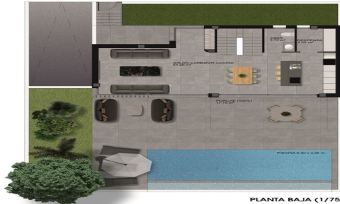
PLANTA BAJA (1/75)

PARCELA 05 271.00 m 2 SUPERFICIE CONSTRUIDA SÓTANO 180.50 m 2 SUPERFICIE CONSTRUIDA PLANTA BAJA 80.90 m 2 SUPERFICIE CONSTRUIDA PLANTA PISO 45.50 m 2 SUPERFICIE CONSTRUIDA TOTAL 306.90 m 2 SUPERFICIE CONSTRUIDA TOTAL COMPUTABLE 208.80 m 2