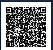
ISO A3 - ESCALA 1:75