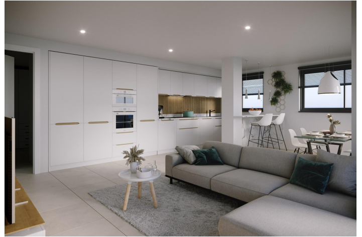
PLANTA PRIMERA / ESCALERA 3 VIVIENDA 1