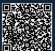
OPCIÓN 1 EMPLAZAMIENTO