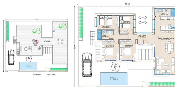
PLANTA BAJA ESCALA = 1/125