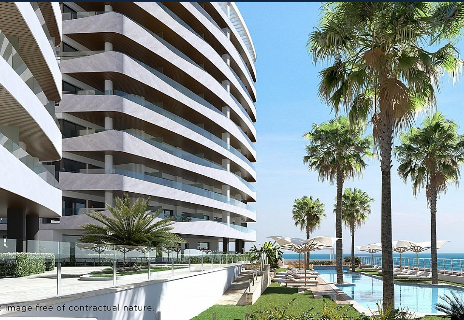
Image free of contractual nature.