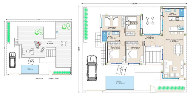
PLANTA BAJA ESCALA = 1/125