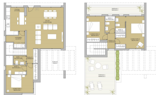
VIVIENDA TIPO V.3 SUPERFICIES ÚTILES / OCCUPABLE AREA PLANTA BAJA / GROUND FLOOR 352,00 m 2 PLANTA PRIMERA / FIRST FLOOR 328,00 m 2 PLANTA SEGUNDA / SECOND FLOOR 328,00 m 2 PLANTA TERCERA / THIRD FLOOR 328,00 m 2 PLANTA CUARTA / FOURTH FLOOR 328,00 m 2 PLANTA QUINTA / FIFTH FLOOR 328,00 m 2 PLANTA SEXTA / SIXTH FLOOR 328,00 m 2 PLANTA SÉPTIMA / SEVENTH FLOOR 328,00 m 2 PLANTA OCTAVA / EIGHTH FLOOR 328,00 m 2 PLANTA NOVENA / NINTH FLOOR 328,00 m 2 PLANTA DÉCIMA / TENTH FLOOR 328,00 m 2 PLANTA DECIMOTERCERA / THIRTEENTH FLOOR 328,00 m 2 PLANTA DECIMOCUARTA / FOURTEENTH FLOOR 328,00 m 2 PLANTA DECIMOQUINTA / FIFTEENTH FLOOR 328,00 m 2 PLANTA DECIMOSEXTA / SIXTEENTH FLOOR 328,00 m 2 PLANTA DECIMOACTA / EIGHTEENTH FLOOR 328,00 m 2 PLANTA DECIMONOVENA / NINETEENTH FLOOR 328,00 m 2 PLANTA VEINTIUNO / TWENTY FIRST FLOOR 328,00 m 2 PLANTA VEINTIDÓS / TWENTY SECOND FLOOR 328,00 m 2 PLANTA VEINTITRÉS / TWENTY THIRD FLOOR 328,00 m 2 PLANTA VEINTICUATRO / TWENTY FOURTH FLOOR 328,00 m 2 PLANTA VEINTICINCO / TWENTY FIFTH FLOOR 328,00 m 2 PLANTA VEINTISÉIS / TWENTY SIXTH FLOOR 328,00 m 2 PLANTA VEINTISIETE / TWENTY SEVENTH FLOOR 328,00 m 2 PLANTA VEINTIOCHO / TWENTY EIGHTH FLOOR 328,00 m 2 PLANTA VEINTINUEVE / TWENTY NINTH FLOOR 328,00 m 2 PLANTA TREINTA / THIRTY FLOOR 328,00 m 2 PLANTA TREINTA Y UNO / THIRTY ONE FLOOR 328,00 m 2 PLANTA TREINTA Y DOS / THIRTY TWO FLOOR 328,00 m 2 PLANTA TREINTA Y TRES / THIRTY THREE FLOOR 328,00 m 2 PLANTA TREINTA Y CUATRO / THIRTY FOUR FLOOR 328,00 m 2 PLANTA TREINTA Y CINCO / THIRTY FIVE FLOOR 328,00 m 2 PLANTA TREINTA Y SEIS / THIRTY SIX FLOOR 328,00 m 2 PLANTA TREINTA Y SIETE / THIRTY SEVEN FLOOR 328,00 m 2 PLANTA TREINTA Y OCHO / THIRTY EIGHT FLOOR 328,00 m 2 PLANTA TREINTA Y NUEVE / THIRTY NINE FLOOR 328,00 m 2 PLANTA CUARENTA / FORTY FLOOR 328,00 m 2 PLANTA CUARENTA Y UNO / FORTY ONE FLOOR 328,00 m 2 PLANTA CUARENTA Y DOS / FORTY TWO FLOOR 328,00 m 2 PLANTA CUARENTA Y TRES / FORTY THREE FLOOR 328,00 m 2 PLANTA CUARENTA Y CUATRO / FORTY FOUR FLOOR 328,00 m 2 PLANTA CUARENTA Y CINCO / FORTY FIVE FLOOR 328,00 m 2 PLANTA CUARENTA Y SEIS / FORTY SIX FLOOR 328,00 m 2 PLANTA CUARENTA Y SIETE / FORTY SEVEN FLOOR 328,00 m 2 PLANTA CUARENTA Y OCHO / FORTY EIGHT FLOOR 328,00 m 2 PLANTA CUARENTA Y NUEVE / FORTY NINE FLOOR 328,00 m 2 PLANTA CINCUENTA / FIFTY FLOOR 328,00 m 2 PLANTA CINCUENTA Y UNO / FIFTY ONE FLOOR 328,00 m 2 PLANTA CINCUENTA Y DOS / FIFTY TWO FLOOR 328,00 m 2 PLANTA CINCUENTA Y TRES / FIFTY THREE FLOOR 328,00 m 2 PLANTA CINCUENTA Y CUATRO / FIFTY FOUR FLOOR 328,00 m 2 PLANTA CINCUENTA Y CINCO / FIFTY FIVE FLOOR 328,00 m 2 PLANTA CINCUENTA Y SEIS / FIFTY SIX FLOOR 328,00 m 2 PLANTA CINCUENTA Y SIETE / FIFTY SEVEN FLOOR 328,00 m 2 PLANTA CINCUENTA Y OCHO / FIFTY EIGHT FLOOR 328,00 m 2 PLANTA CINCUENTA Y NUEVE / FIFTY NINE FLOOR 328,00 m 2 PLANTA SESENTA / SIXTY FLOOR 328,00 m 2 PLANTA SESENTA Y UNO / SIXTY ONE FLOOR 328,00 m 2 PLANTA SESENTA Y DOS / SIXTY TWO FLOOR 328,00 m 2 PLANTA SESENTA Y TRES / SIXTY THREE FLOOR 328,00 m 2 PLANTA SESENTA Y CUATRO / SIXTY FOUR FLOOR 328,00 m 2 PLANTA SESENTA Y CINCO / SIXTY FIVE FLOOR 328,00 m 2 PLANTA SESENTA Y SEIS / SIXTY SIX FLOOR 328,00 m 2 PLANTA SESENTA Y SIETE / SIXTY SEVEN FLOOR 328,00 m 2 PLANTA SESENTA Y OCHO / SIXTY EIGHT FLOOR 328,00 m 2 PLANTA SESENTA Y NUEVE / SIXTY NINE FLOOR 328,00 m 2 PLANTA SETENTA / SEVENTY FLOOR 328,00 m 2 PLANTA SETENTA Y UNO / SEVENTY ONE FLOOR 328,00 m 2 PLANTA SETENTA Y DOS / SEVENTY TWO FLOOR 328,00 m 2 PLANTA SETENTA Y TRES / SEVENTY THREE FLOOR 328,00 m 2 PLANTA SETENTA Y CUATRO / SEVENTY FOUR FLOOR 328,00 m 2 PLANTA SETENTA Y CINCO / SEVENTY FIVE FLOOR 328,00 m 2 PLANTA SETENTA Y SEIS / SEVENTY SIX FLOOR 328,00 m 2 PLANTA SETENTA Y SIETE / SEVENTY SEVEN FLOOR 328,00 m 2 PLANTA SETENTA Y OCHO / SEVENTY EIGHT FLOOR 328,00 m 2 PLANTA SETENTA Y NUEVE / SEVENTY NINE FLOOR 328,00 m 2 PLANTA CIENTO / ONE HUNDRED FLOOR 328,00 m 2