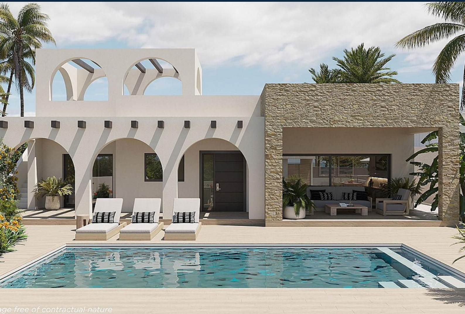
Image free of contractual nature