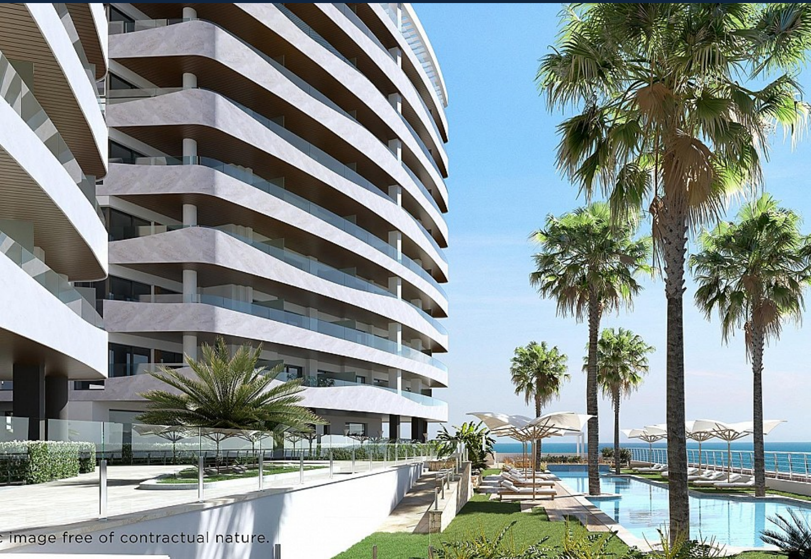
Image free of contractual nature.