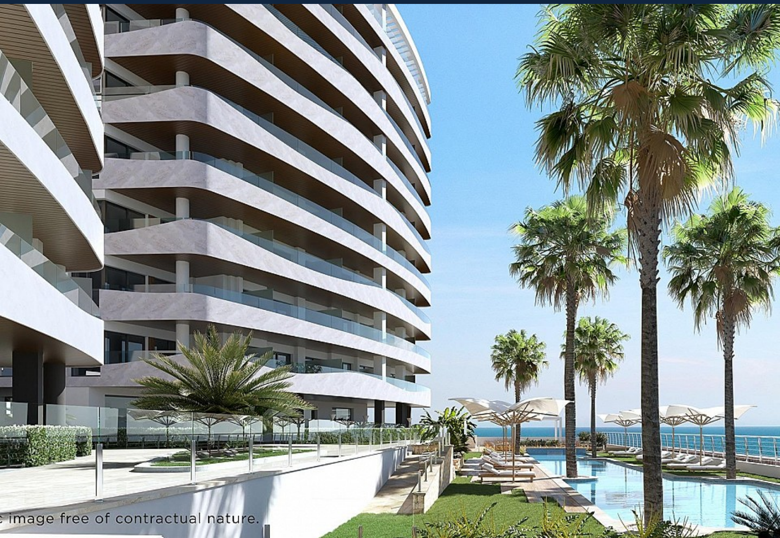
Image free of contractual nature.